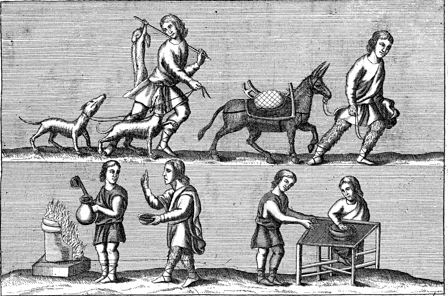
Iconismus hic pertinet ad Commentariorum de Augustissimâ Bibliothecâ Casareâ Vindobonensi Librum tertium, et est inserendus inter pag. 6 et 7.